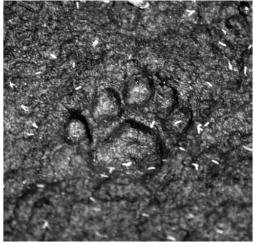
Petjada de geneta: pota davantera dreta. Fixeu-vos en el cinquè dit.

També costa una mica distingir-la de la del gat salvatge. La geneta té les marques més juntes entre si i ofereix un aspecte més llarg que ample, mentre que la del gat és més arrodonida. El coixinet principal del gat salvatge té tres lòbuls alineats, mentre que la geneta en té dos i un tercer al mig molt més petit i més cap a endins. Les petjades solen fer 3'5 cm de llarg per 3 cm d'amplada.