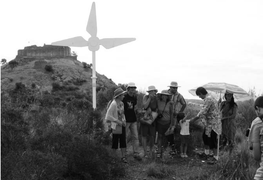
20-8-2010. Moment de l'acció reivindicativa davant del castell de Quermançó a Vilajuïga.

Davant d'aquesta acumulació d'incoherències i faltes administratives, vam demanar al Govern de la Generalitat que suspengués i retirés l'Acord de Govern de la determinació de les ZDP, i al Departament d'Economia i Finances i especialment a la Direcció General d'Energia i Mines un compromís per un Pla Comarcal de l'Energia que planifiqui globalment totes les fonts d'energia renovables, prioritzant la reducció del consum i la millora de l'eficiència, apostant decididament per la microgeneració i incentivant que els projectes siguin promoguts des del teixit social. Finalment, vam demanar també, al Departament de Cultura i Mitjans de Comunicació i al Departament de Medi Ambient i Habitatge, que exerceixin les seves competències en protegir els valors naturals i culturals de la nostra comarca.