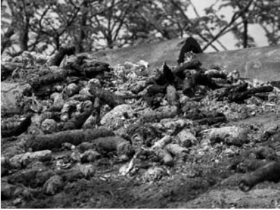
Latrina sobre una construcció.